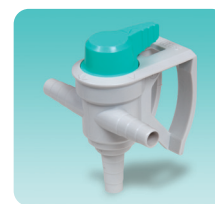
●吸引シフトバルブ プラスチック