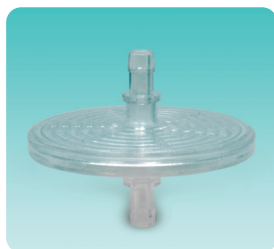
●バキュームフィルター