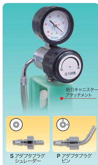
●吸引圧力調整器 HK-333型