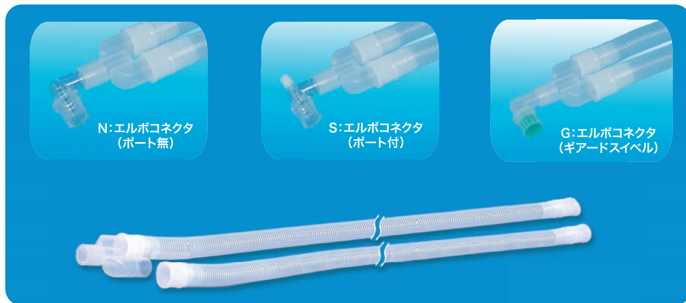
N:エルボコネクタ (ポート無)

患者口元のYピースと吸気管、呼気管の着脱ができますので、定量噴霧式吸入器(MDIチャンバー)や一酸化窒素吸入療法(NO療法)用コネクタなどの組み入れが可能です。(22mmテーパ接合)