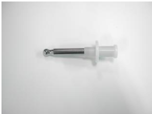
8mm→4mm タイプ 全長 80mm