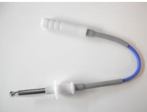
8mm→5mm タイプ 全長 250mm