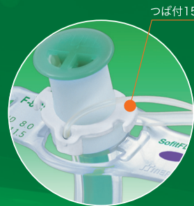
15mmコネクタの拡大図