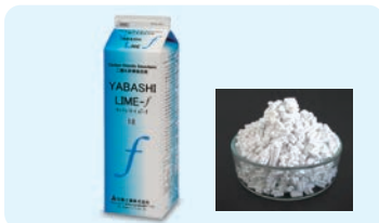
ヤバシライム(CO 2 吸収剤)