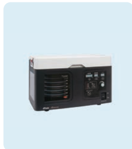
メラ麻酔用ベンチレータ Minoris