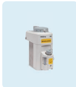
V60 麻酔薬気化器 (セボフルラン用)