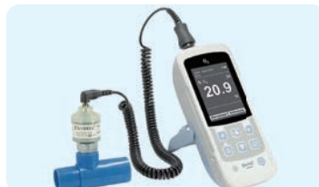
マイサインO 2 (酸素濃度計)